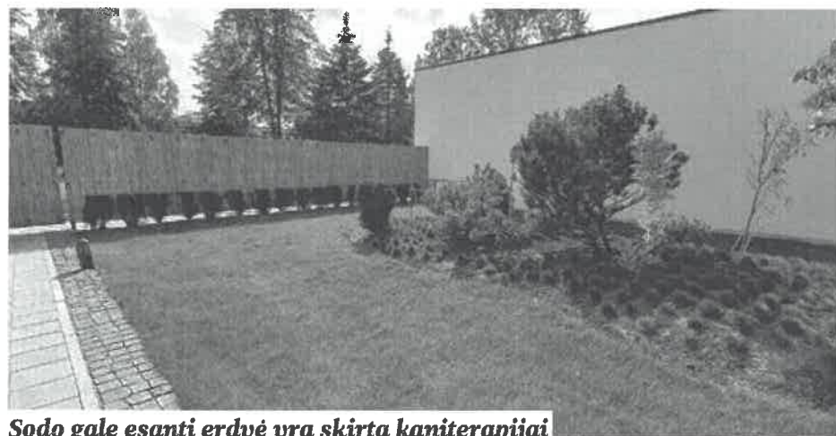
Sodo gale esanti erdvė yra skirta kaniterapijai